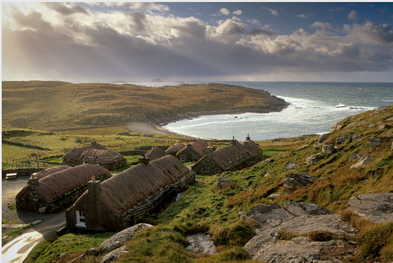
Garenin Blackhouses village, Lewis, Hébrides extérieures. Pentax 67 II, Velvia. .