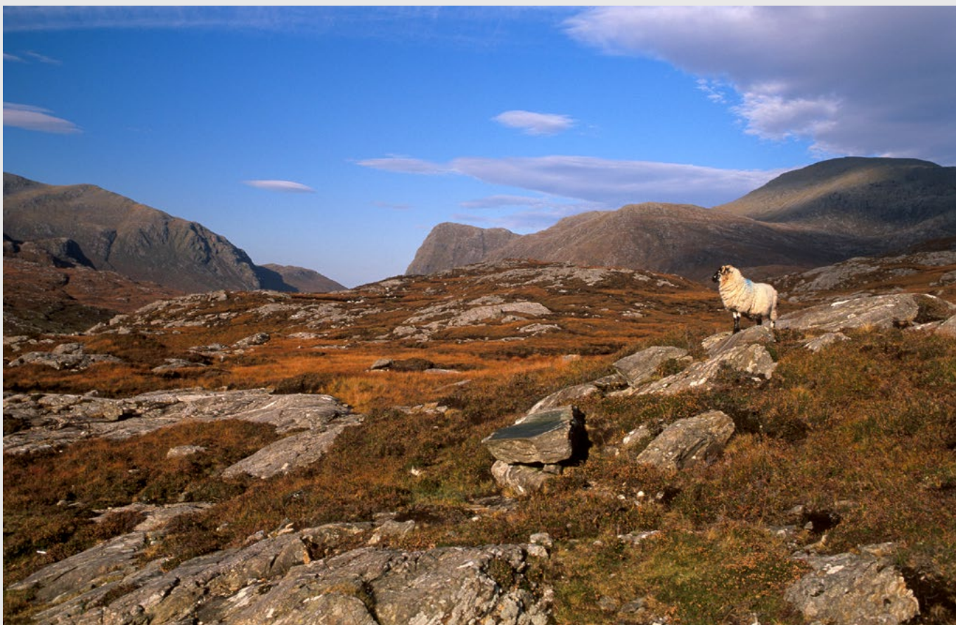
Les collines de Harris, Pentax 67 II, Velvia.