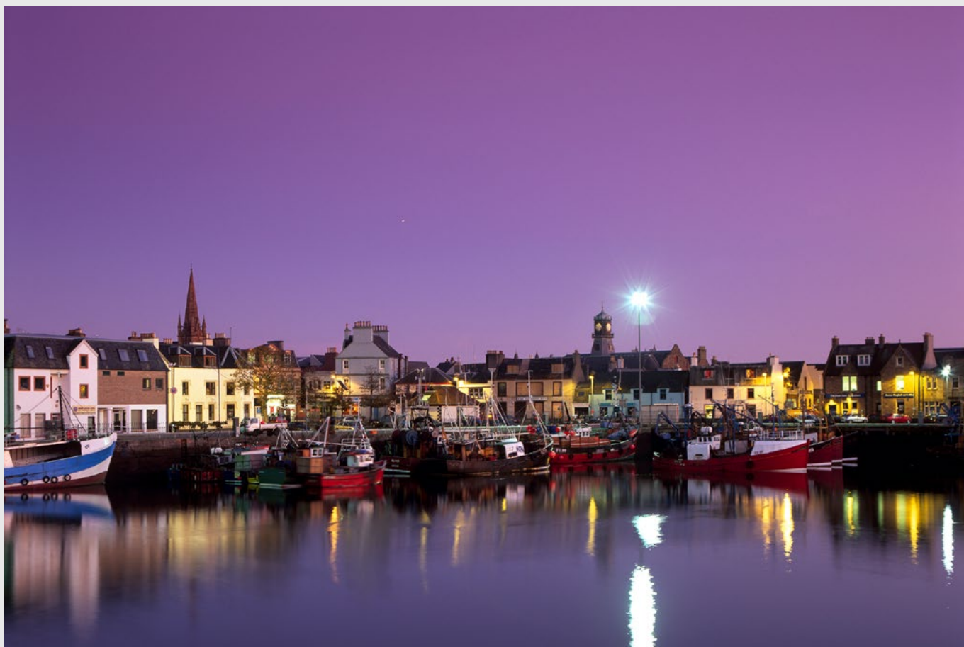
Le port de Stornoway, la nuit, Pentax 67 II, Velvia.