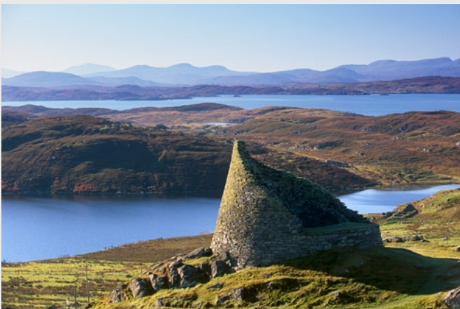
Dun Carloway broch, sur Lewis.