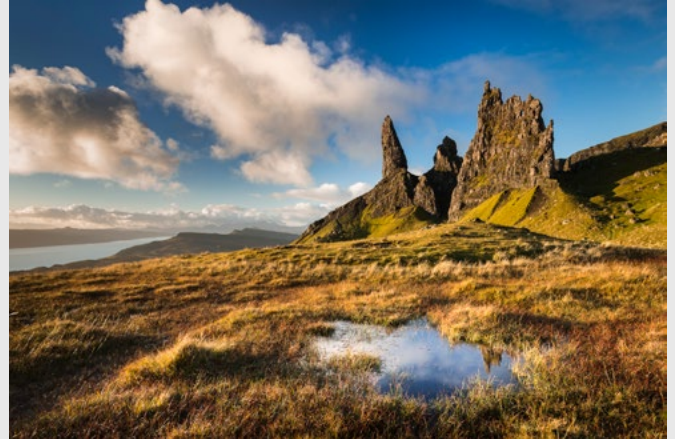
Old Man of Storr, Skye, D850, 24-70 mm.