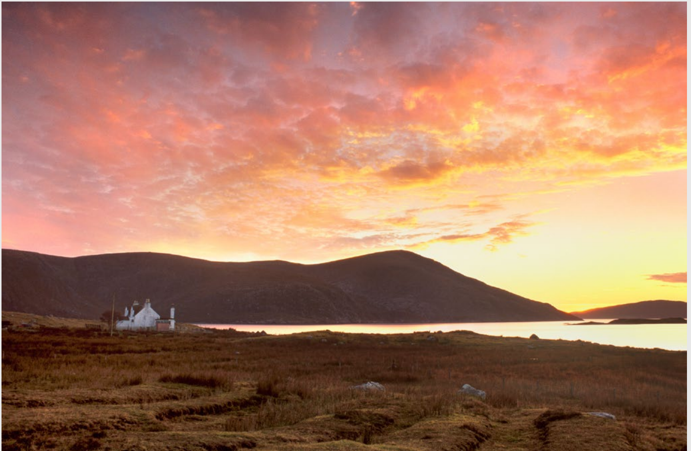
Couchant sur West loch Tarbert, North Harris..