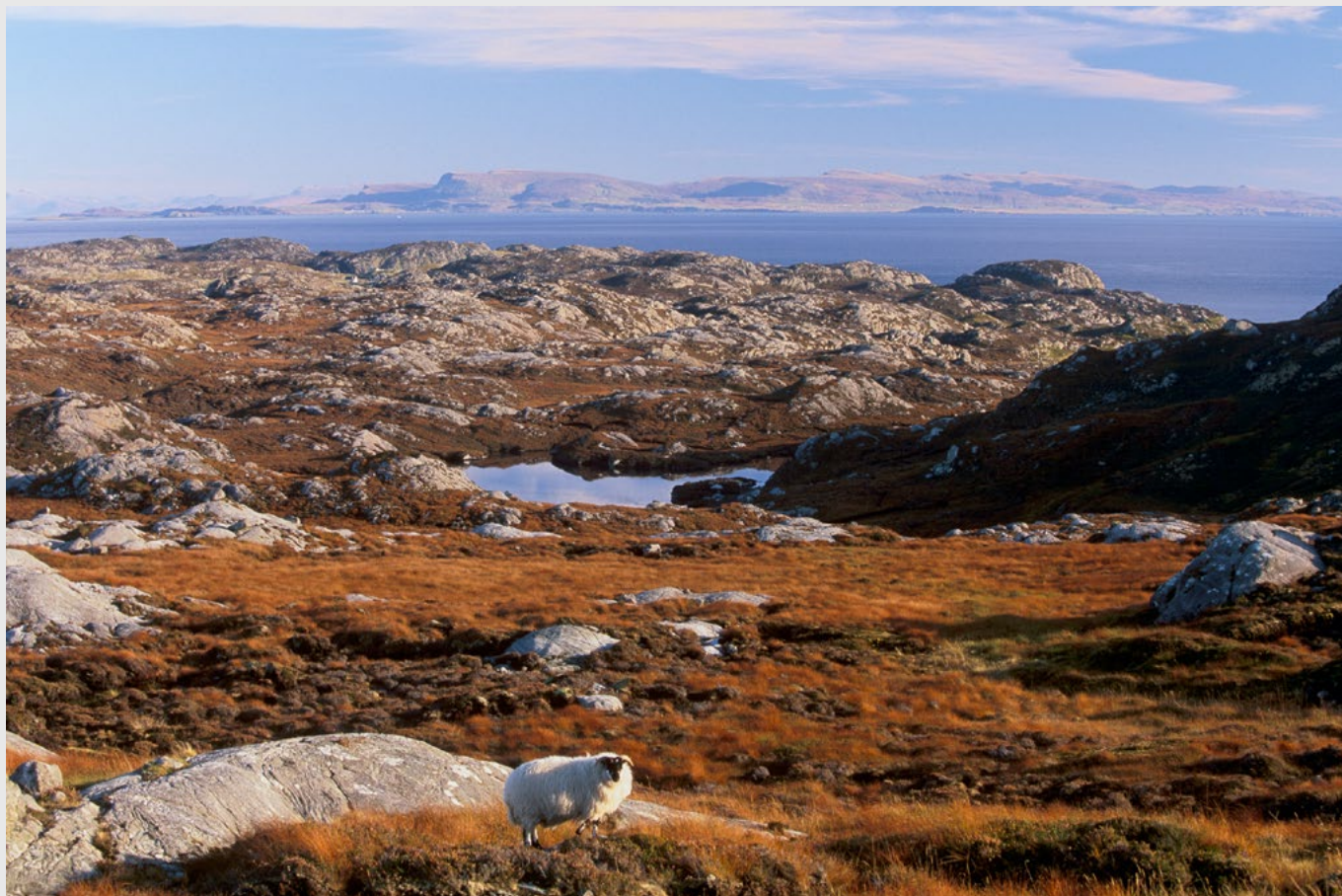
Paysage désolé sur la côte est de South Harris, l'île de Skye au loin. - Nikon F5, 70-200 mm, Velvia.