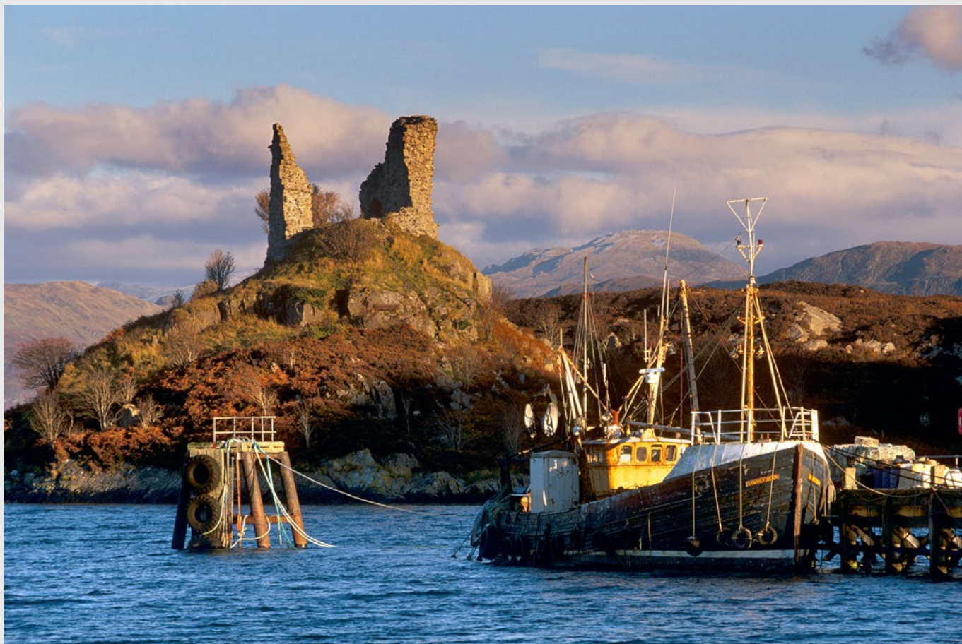
Castle Moil, île de Skye, Ecosse, Nikon F5, 24-70 mm, velvia film.