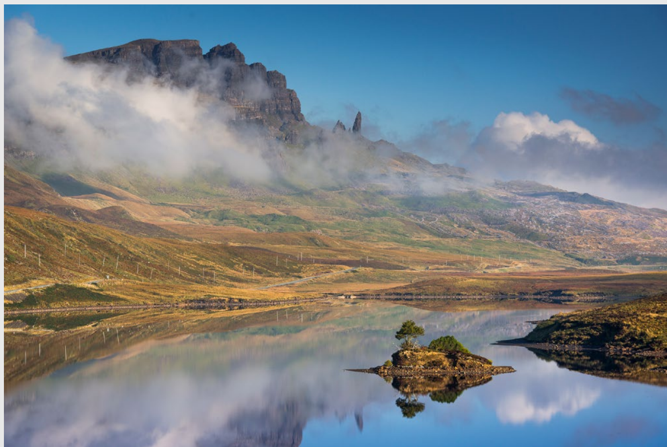
Vue sur le Storr et Old Man depuis le loch Fada, île de Skye, Ecosse - Nikon D850, 70-200 mm.