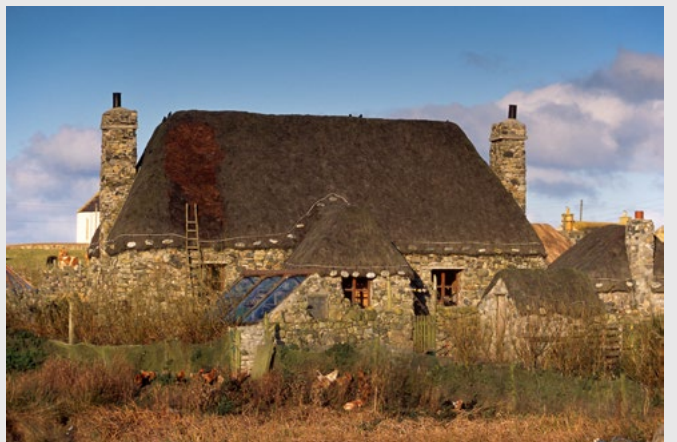
Maison traditionnelle sur Uist.