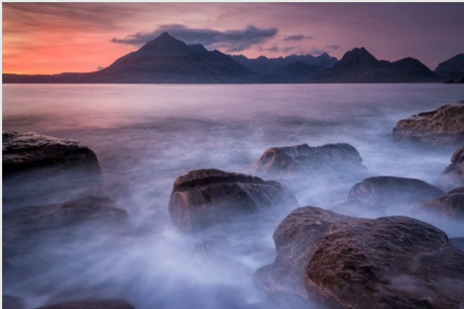
Côte rocheuse à Elgol, île de Skye, D800E, 17-35 mm.