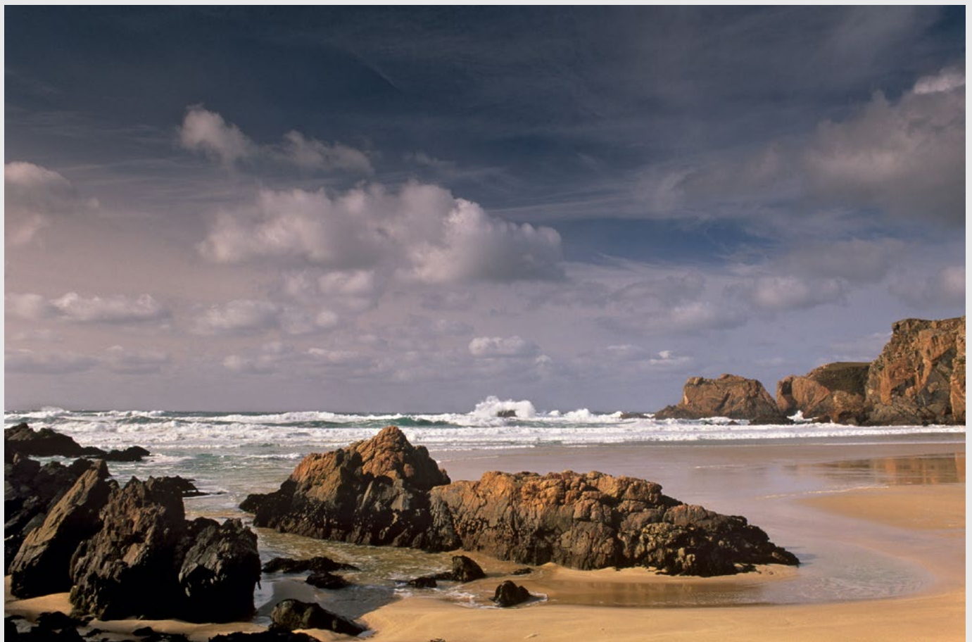
Mangersta Sands, Lewis, Hébrides extérieures, Nikon F5, Velvia film.