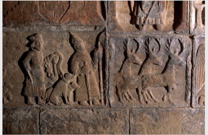
Tombeau d'un chef de clan MacLeod, dans l'église, 16e S.