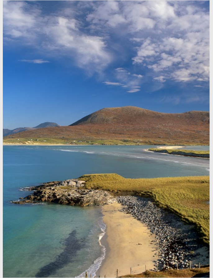
Lewis, côte ouest, Nikon F5, 24-70 mm. -- Plage de Luskentyre sur Harris, Pentax 67 II.