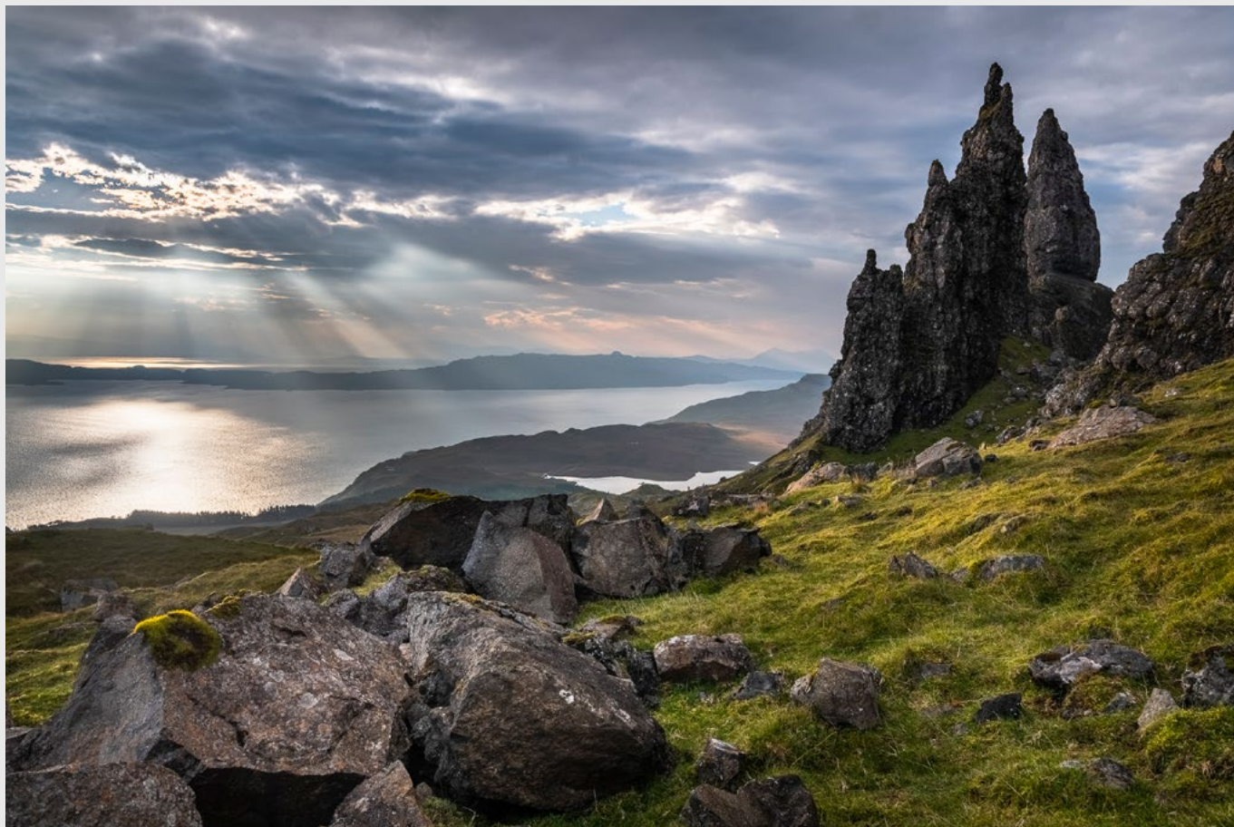
Old Man of Storr, île de Skye, Ecosse - Nikon D850, 24-70 mm.