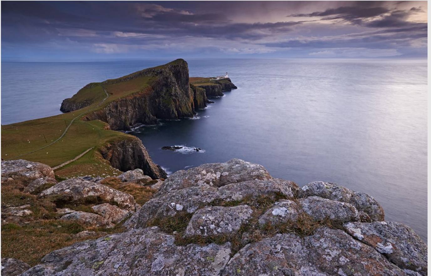
Neist Point, extrémité occidentale de l'île de Skye - Nikon D850, 17-35 mm.

Page précédente, de haut en bas : Loch Cill Chriosd, île de Skye, panoramique par assemblage - Phare d'Isleornsay, île de Skye - Sgurr nan Gillean, Black Cuillins, île de Skye - Chaîne des Red Cuillins, île de Skye, panoramique par assemblage.