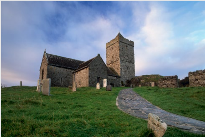
L'église St Clement, 16e S, sur Harris.

J'attire également votre attention sur le confort du photographe. Il est pénible d'attendre les bonnes lumières en extérieur si l'on a froid ou que l'on est mouillé, alors qu'un bon coupe-vent ou pantalon goretex, avec de bonnes chaussures imperméables, et les sous-couches adaptées, vous permettent de rester dans votre «zone de confort» pendant de longues heures, parfaitement disponible pour apprécier sereinement la beauté de la nature et les possibilités photo. Là aussi mon expérience de terrain me permet de vous conseiller au mieux.