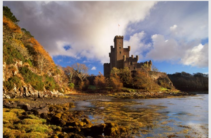
Le château de Dunvegan, île de Skye, Pentax 67II.