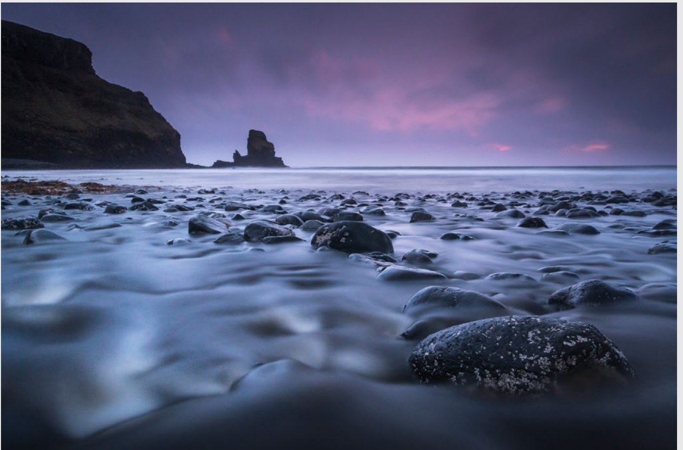
Talisker Bay, Talisker Rock, île de Skye, pose lente - Nikon D5, 14-24 mm.

Page précédente, de haut en bas : Loch Cill Chriosd, île de Skye, panoramique par assemblage - Phare d'Isleornsay, île de Skye - Sgurr nan Gillean, Black Cuillins, île de Skye - Chaîne des Red Cuillins, île de Skye, panoramique par assemblage.