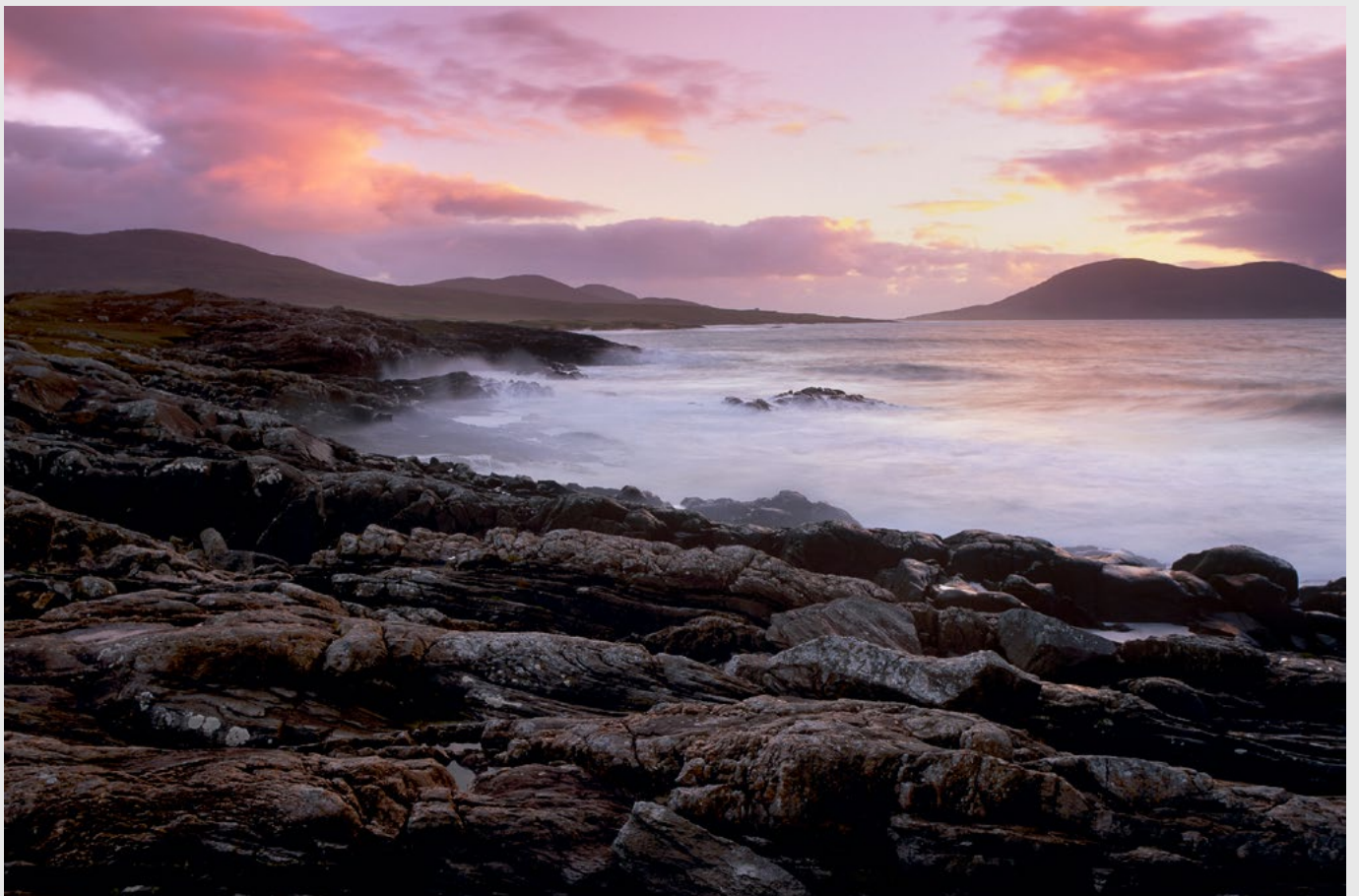
Côte rocheuse du détroit de Taransay, Chaipaval, sur Harris. Pentax 67 II, Velvia.