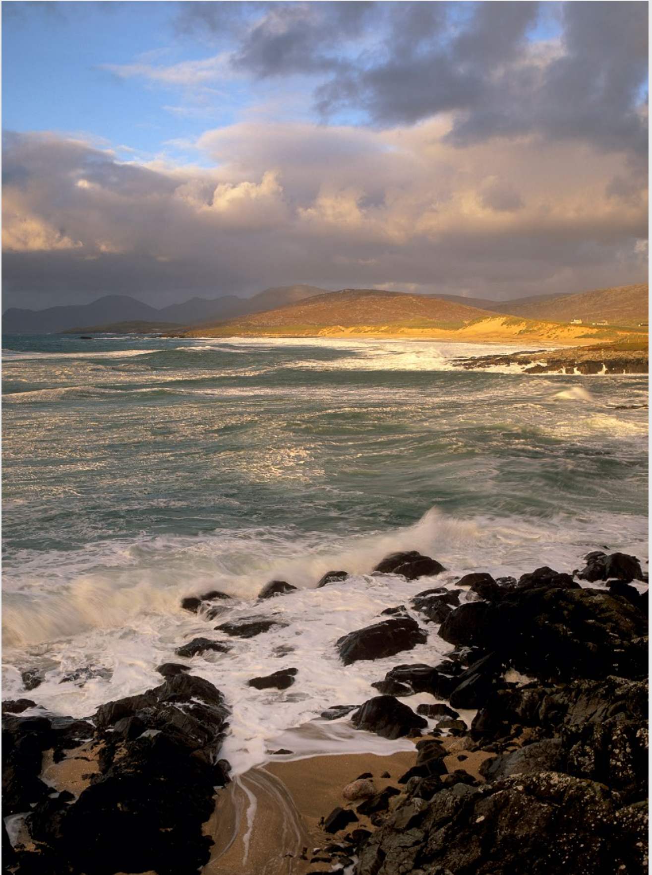
Détroit de Taransay, Harris, Pentax 67 II, Velvia.