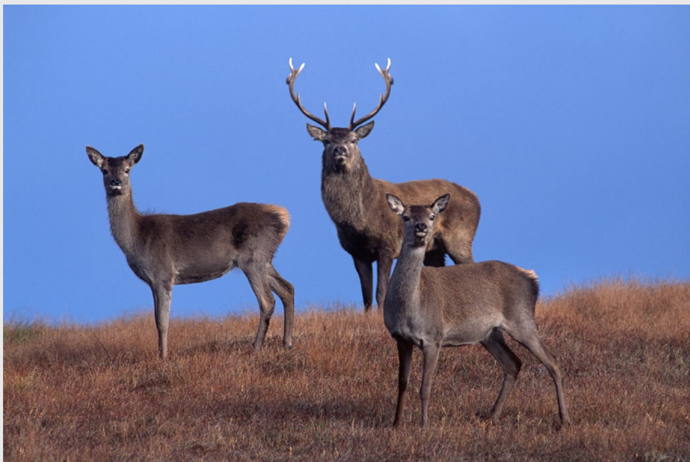
Cerfs sur les collines de Harris, Nikon F5, 300 mm, Velvia.