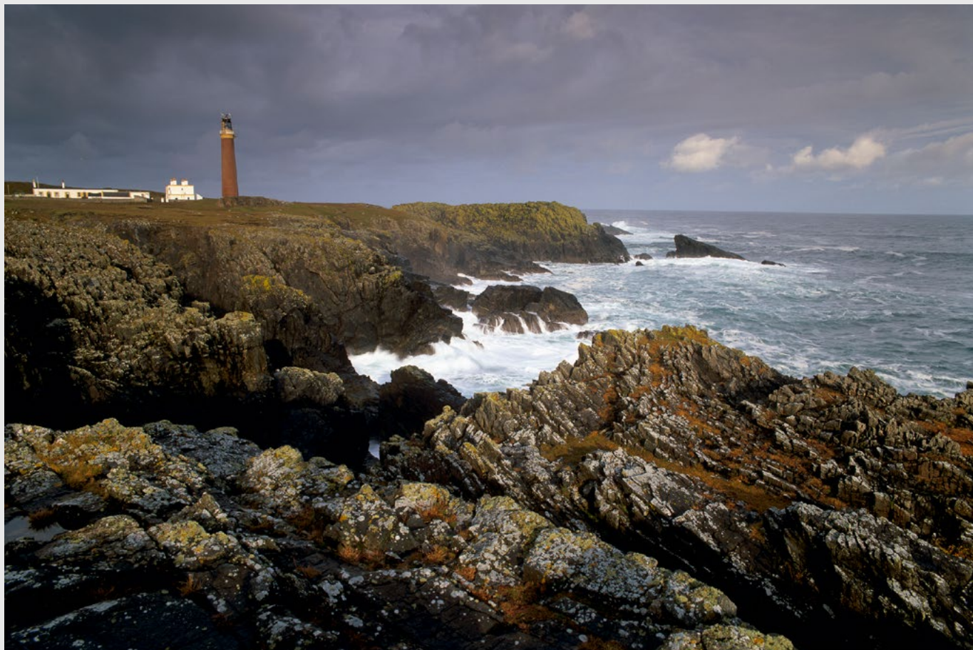
Le phare de Butt of Lewis, Lewis, Hébrides extérieures, Pentax 67 II, Velvia.