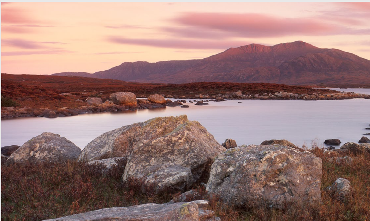
Loch Druidibeg Nature Reserve, South Uist, Hébrides extérieures, Fuji GX 617, Velvia film.