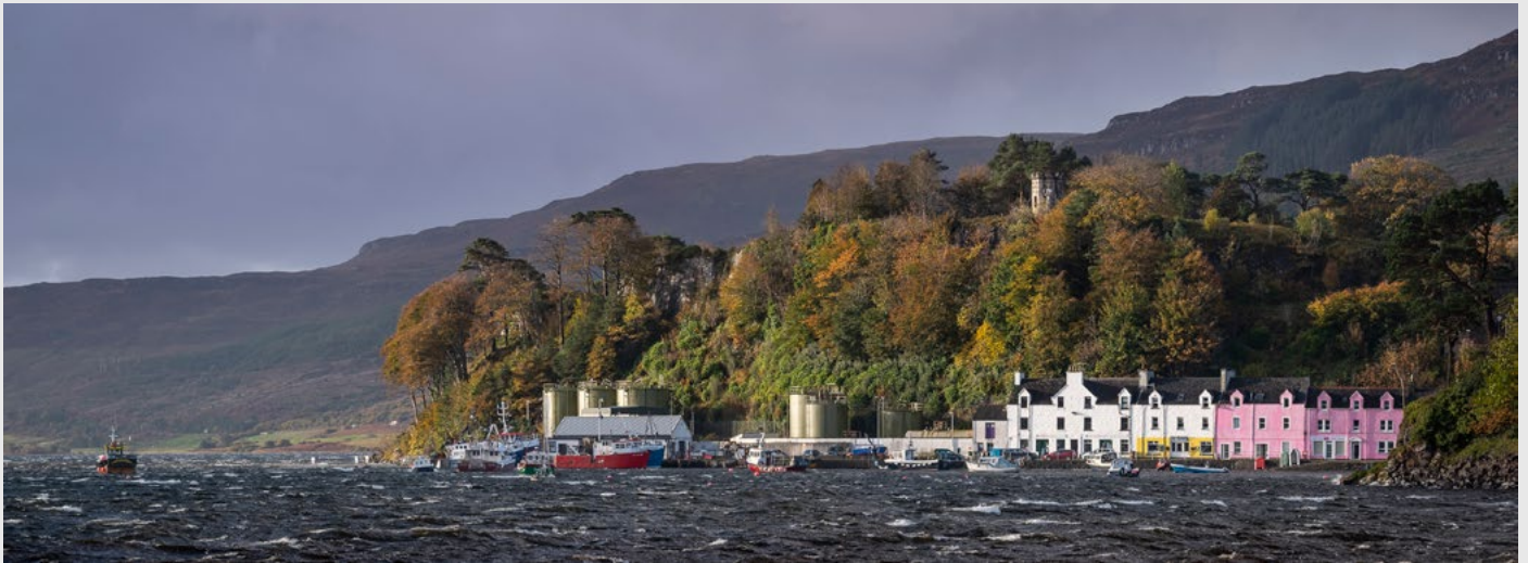
Les maisons colorées du port de Portree, sur Skye, panoramique par assemblage, Nikon D5, 70-200 mm.