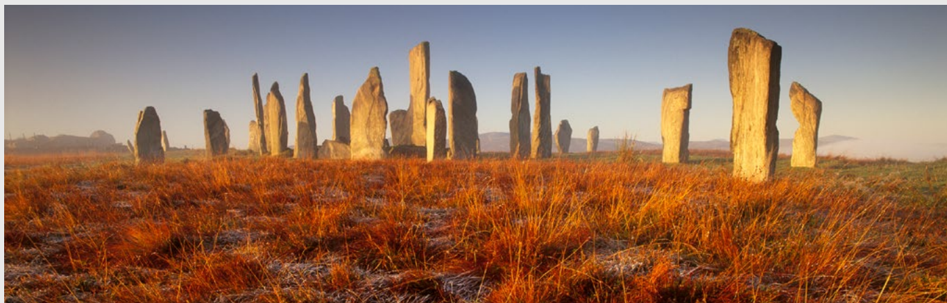
Le cercle de pierres de Callanish, classé au patrimoine mondial, sur Lewis. Fuji GX 617, Velvia.