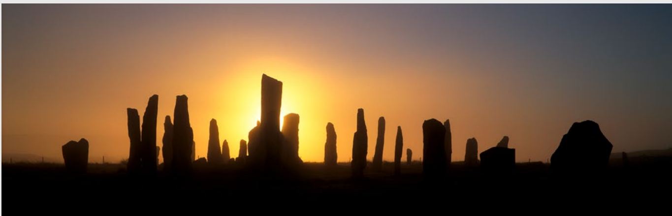
Le cercle de pierres de Callanish, classé au patrimoine mondial, sur Lewis. Fuji GX 617, Velvia. .