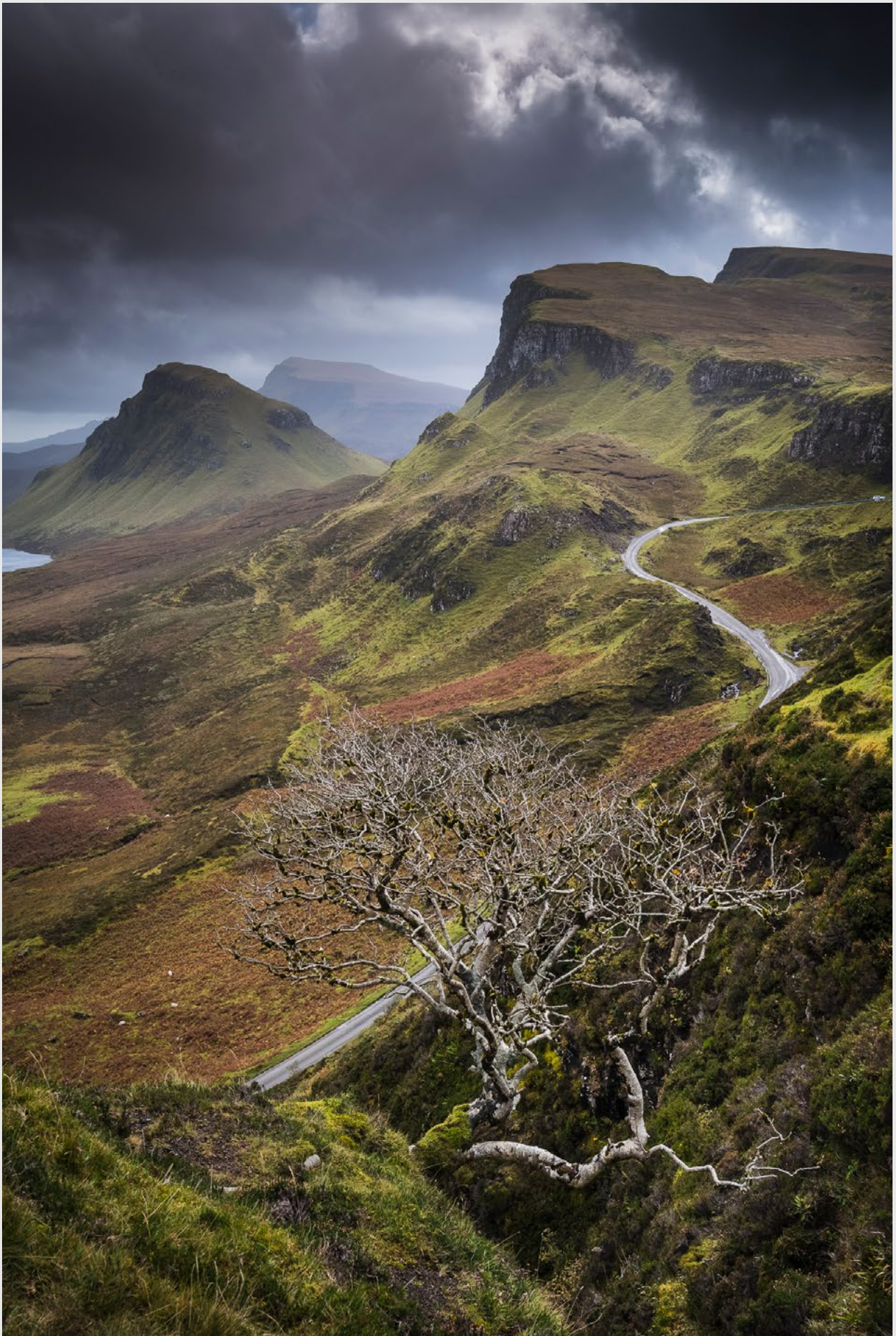
Massif du Quiraing, île de Skye, Ecosse - Nikon Z8, 24-70 mm.