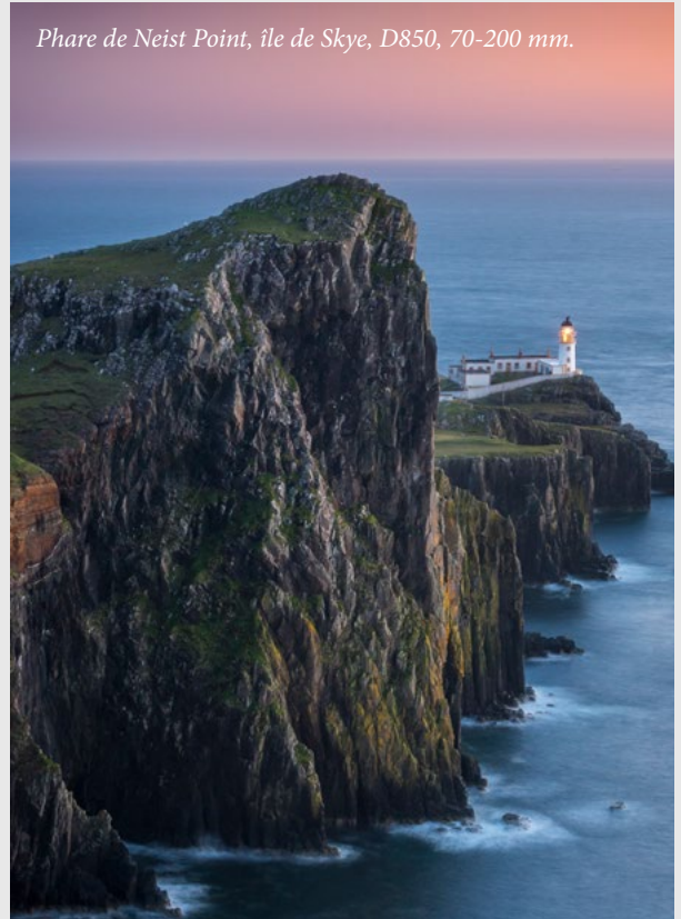
Phare de Neist Point, île de Skye, D850, 70-200 mm.

Il ne faut pas s'en faire à ce sujet ... J'ai accompagné des groupes de photographes de tous niveaux en Italie, Ecosse, Islande, etc. durant plusieurs années, pour le compte d'une agence de voyages photo, et depuis plus de dix ans je guide mes propres voyages photo, en indépendant, avec des agences de voyages françaises agréées. Cela m'offre la liberté que j'attendais, et un contact plus personnel avec les photographes qui me font confiance.