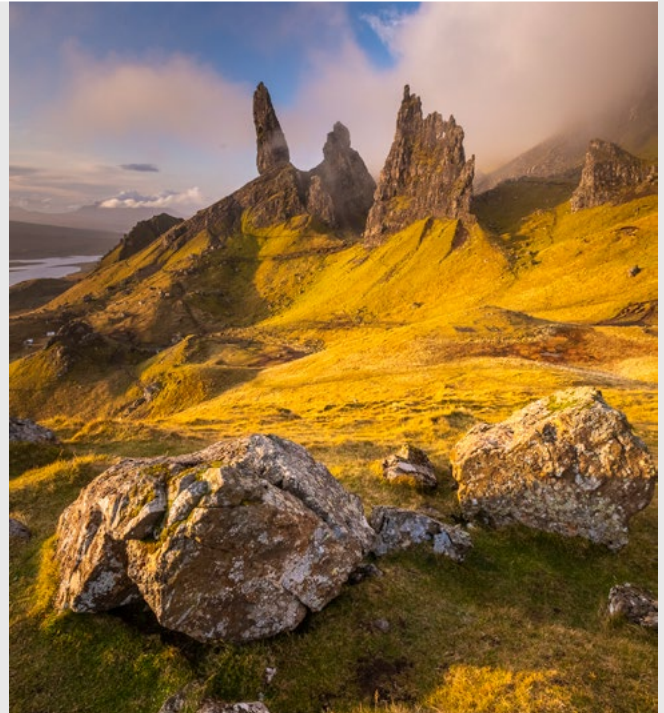
Old Man of Storr, sur Skye, Nikon D850, 14-24 mm.

(Informations données à titre indicatif et valables à la date de parution du Carnet de Voyage, pour des personnes de nationalité française. Des changements sont possibles. Renseignez-vous auprès des organismes compétents avant votre voyage)