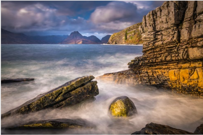
Côte rocheuse à Elgol, île de Skye, D850, 17-35 mm.