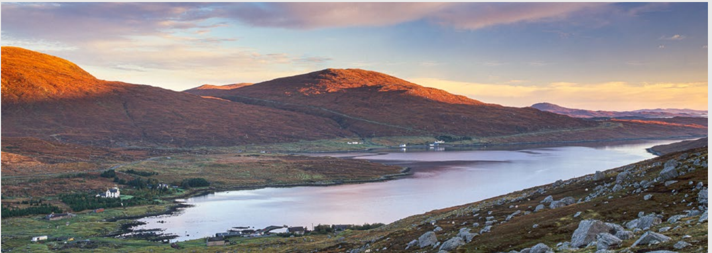
Loch Seaforth, North Harris, Pentax 67 II, Velvia.

Mon équipement numérique actuel pour le paysage/reportage me permet de couvrir des focales de 14 à 280 mm, avec 2 boîtiers (Z9, Z8). J'utilise des objectifs Nikon, principalement les suivants: 14-24 f2.8, 24-70 f2.8 et 70-200 f4, avec convertisseur 1.4 x au besoin. En paysage je tiens particulièrement à emporter une courte focale (en dessous de 24 mm), pour des compositions intégrant des 1ers plans dynamiques. D'autres choix sont tout à fait possibles, et dépendent aussi du budget consacré à votre équipement. Nikon et Canon, et autres marques, proposent des zooms 18-35, 17-40, 24-120, et 70-200 à f4, moins onéreux et moins lourds, et de très bonne qualité. Vous pouvez aussi remplacer un 70-200 par un 100-400 pour plus d'amplitude. (Les focales sont données ici pour un format plein capteur (FF), 24x36 mm)