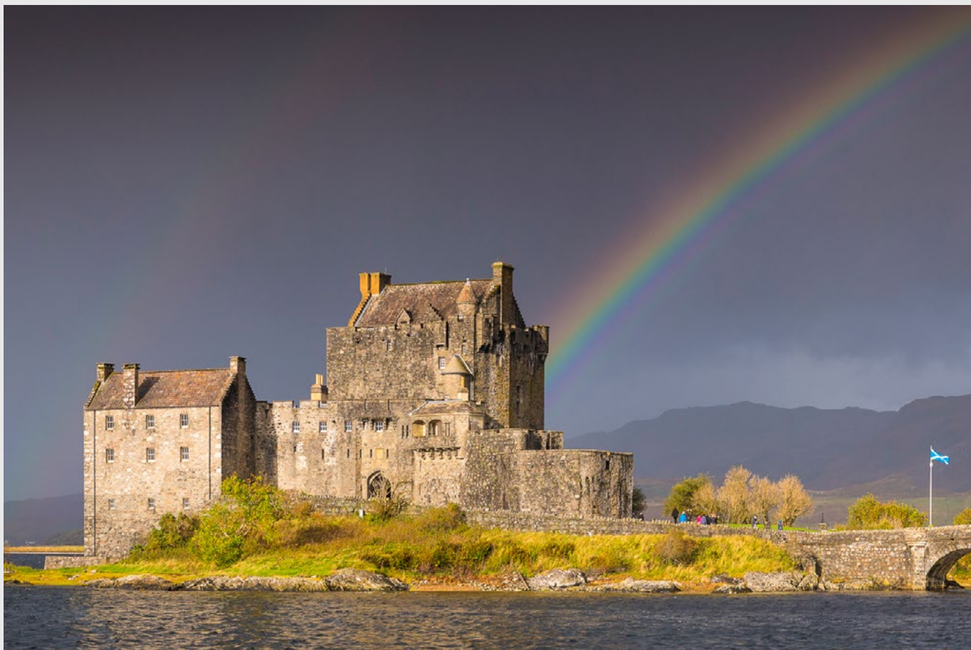
Eilean Donan Castle, près de l'île de Skye, Highlands, Ecosse - Nikon D5, 24-70 mm.