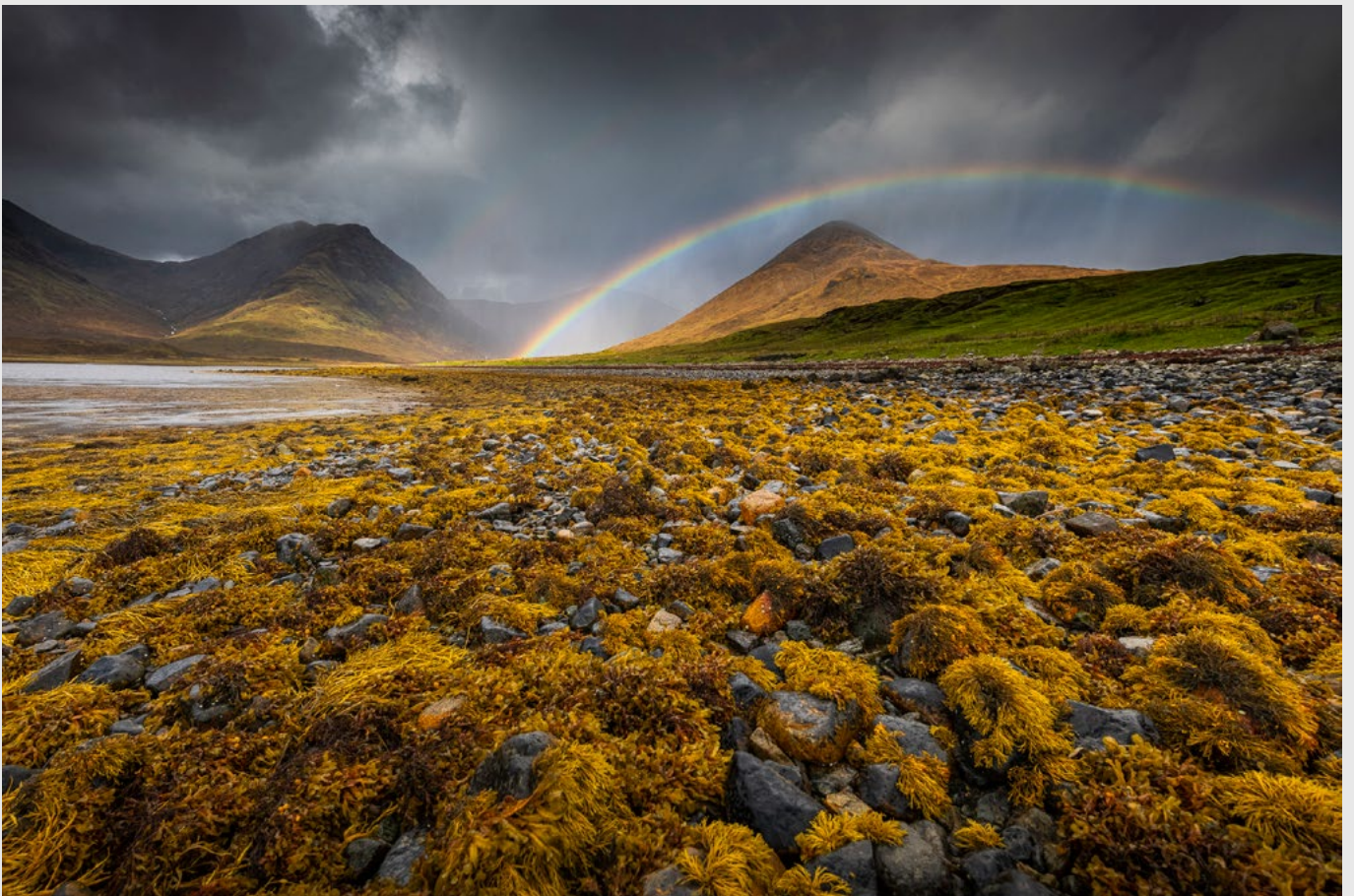
Le loch Ainort et les Black Cuillins, île de Skye - Nikon D5, 14-24 mm.