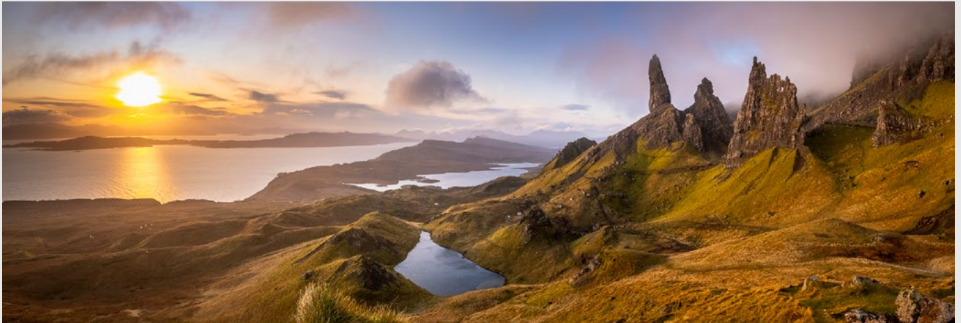
Old Man of Storr, île de Skye, au lever du soleil - Panoramique par assemblage, 6 images, Nikon D850, 24-70 mm.

Voici les étapes de votre inscription à un voyage photographique avec Patrick Dieudonné et ExpéPhoto.